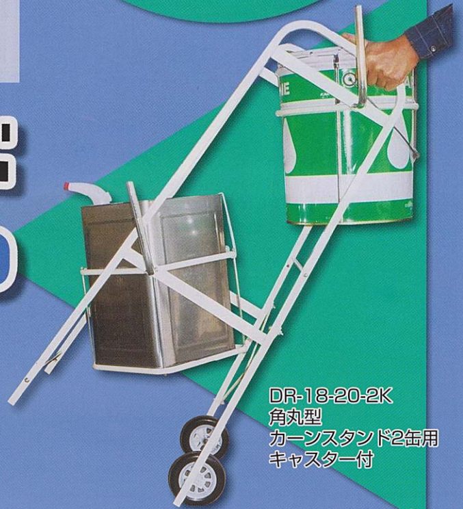
DR-18-20-2K 角丸型 カーンスタンド2缶用 キャスター付