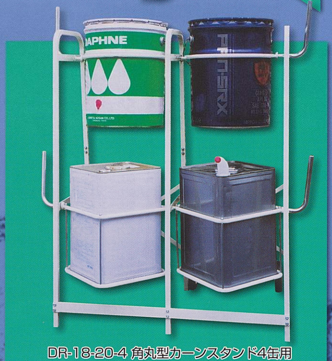
DR-18-20-4 角丸型カーンスタンド4缶用