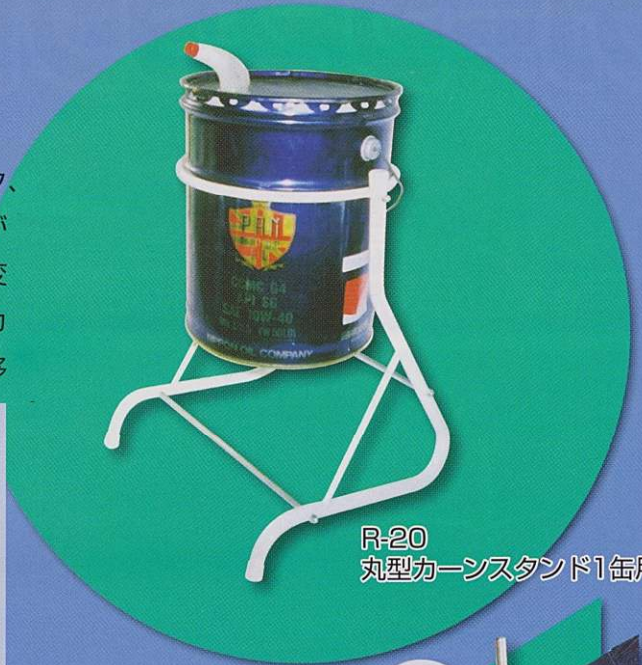
R-20 丸型カーンスタンド1缶用