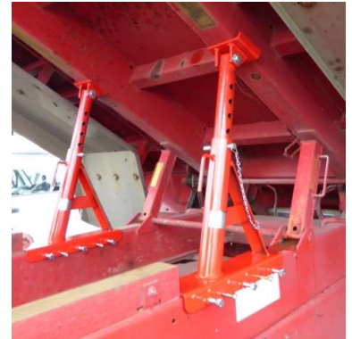
DS-700R用アタッチメント付装着時

受皿立ち上がり部(左右外側) 横ズレ・転倒・落下を防ぐ為で、フチ部分には絶対に荷重を架けないで下さい。変形や転倒の恐れがあり事故につながります。